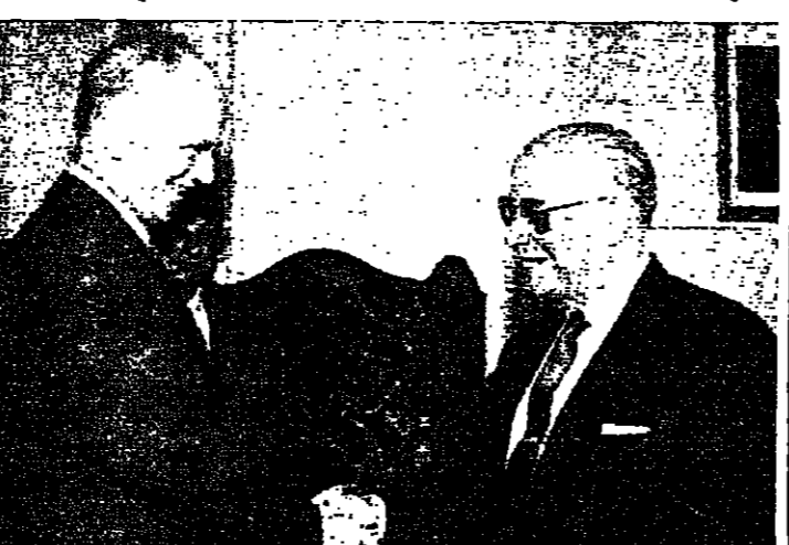
بظنهم الزوجي

قال وزير الخارجية السوري فرس الان (الاحلال السلام) للمنطقة، وقال السيد ستولتنبيرغ - الذي ناقش احتمالات السلام في وقت سابق من العاهل الاردني الملك حسين - انه يسعى للحصول على معلومات، وأنه لا يعمل أي خطة سلام. ومن المقرر ان يزور اسرائيل وسوريا في آذار القادم. وأضاف قوله ان مصر والاردن اللذين يطالبان ملل النزوح ومعظم دول المجموعة الأوروبية يعقد مؤتمر دولي لاحلال السلام بالشرق الاوسط يشعرون بالرجلان في العاصمة التونسية اليوم. ينبغي استغلالها. وقال السيد ستولتنبيرغ عما اذا كان يمكن النزوح ان تشارك في منظمة اسرائيل التي ترفض الحديث مع منظمة التحرير أو الوفاق على عقد مؤتمر دولي التحرك بسرعة بحلها بله توجد